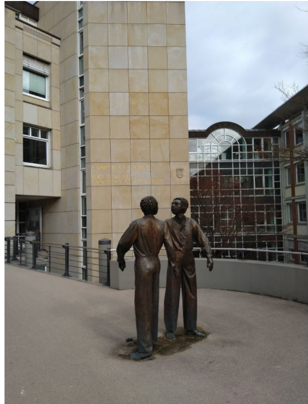
Ob die beiden sich wohl darüber unterhalten, wer in den nächsten Kreistag einziehen wird?

Wahlkreisen an. Nicht in Ehrenkirchen (3), March (4), Neuenburg (6) und Kirchzarten (8). Jeweils ein Kandidat in Gundelfingen und Lenzkirch kann man auch schwerlich Liste nennen.