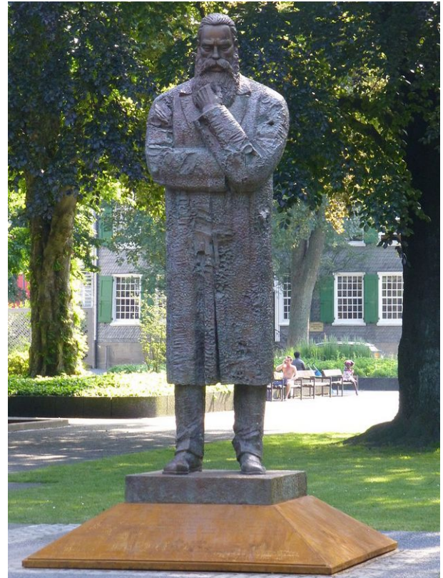
Friedrich Engels: Statue im Wuppertaler Engelsgarten. Im Hintergrund: Das Haus des Fabrikanten Friedrich Engels sen., das heutige Engels-Museum.

Um diese Frage zu beantworten, soll ein Blick zurück zu den Anfängen der deutschen Arbeiterbewegung dienen.